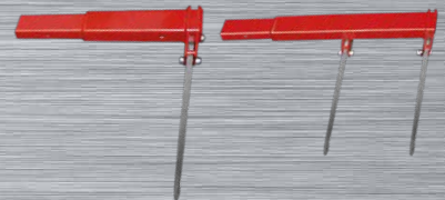
Einsteckbare Greiferverbreiterung 1,6m | 2,2m