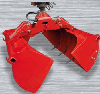
Kombischaufel mit Zinken