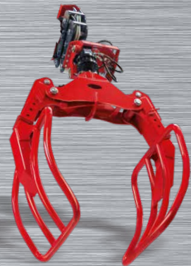
Einsteckbare Rund- und Siloballenzange