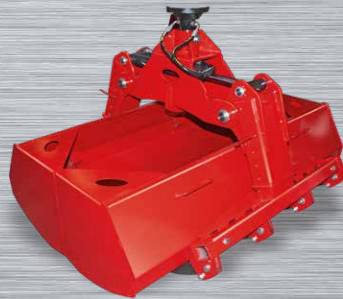
Greiferwanne über Zinken montierbar 1,25m