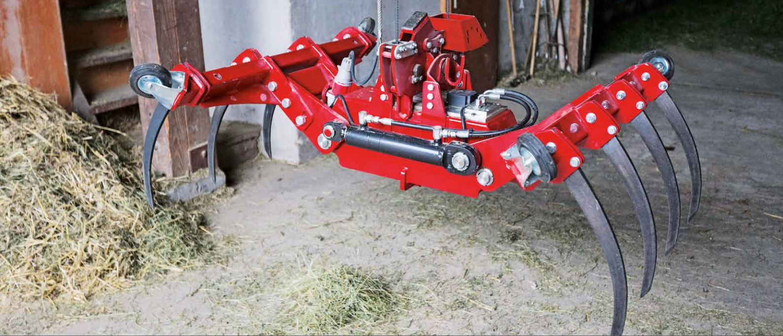
Greifer mit integriertem hydraulischem Aggregat und ansteckbaren Silorollen